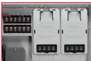
Configuration 12 voies avec 2 modules de 4 voies