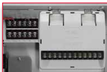
Configuration 16 voies avec 1 module de 12 voies